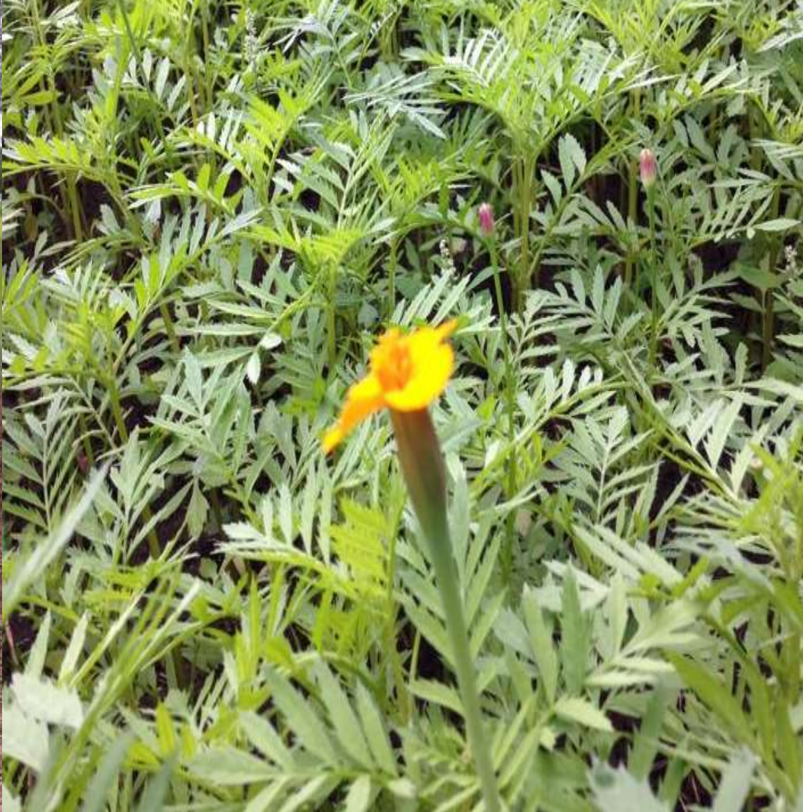
Voorjaar 2015 Bodemverbetering op Wilhelminapark